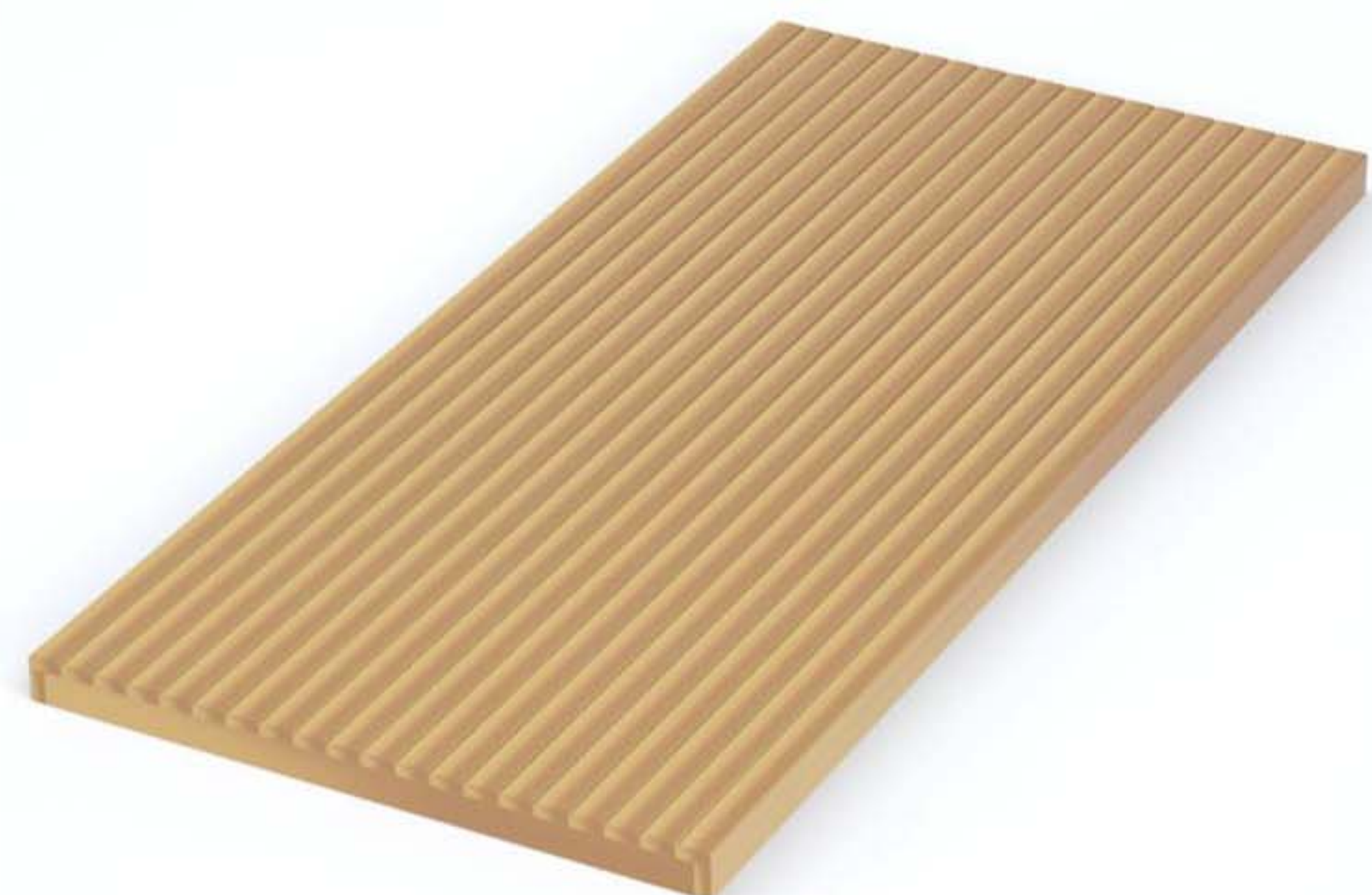
PANEL DE TERRAZA COMPLETO 3.00 X 1.50