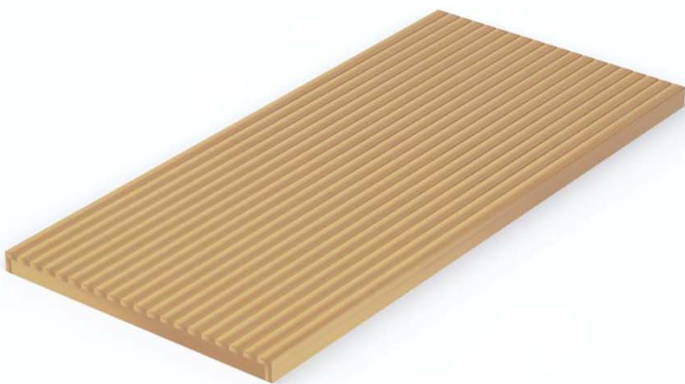
PANEL DE TERRAZA COMPLETO 3.20 X 1.50